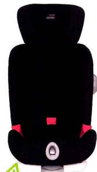
SIÈGE-AUTO ISOFIX ÉVOLUTIF ÉQUIPÉ DE LA TECHNOLOGIE SECUREGUARD. BRITAX, ADVANSAFIX II SICT, GROUPE1/2/3, DE 9 MOIS À 12 ANS, 440 € (WWW.BRITAXFR)