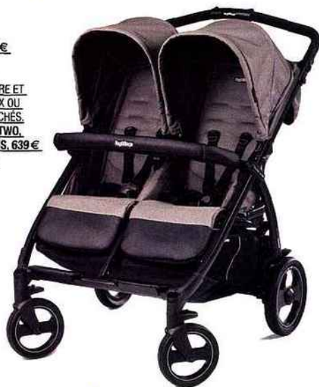
POUSSETTE DOUBLE LÉGÈRE ET COMPACTE POUR JUMEAUX OU ENFANTS D'ÂGES RAPPROCHÉS. PEG-PÉREGO, BOOK FOR TWO, DE LA NAISSANCE À 3 ANS, 639 € (WWW.PEGPEREGO.COM)