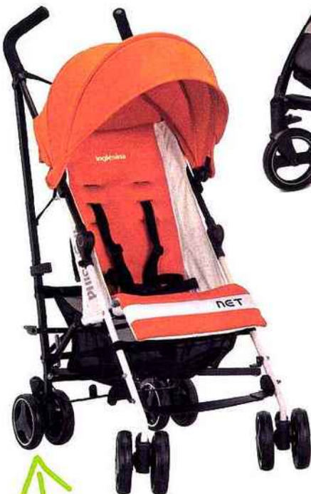
POUSSETTE LÉGÈRE À FERMETURE PARAPLUIE POUR UN ENCOMBREMENT RÉDUIT. INGLESINA, NET, DE 6 MOIS À 15 KG, 150 € (WWW.INGLESINA.FR)