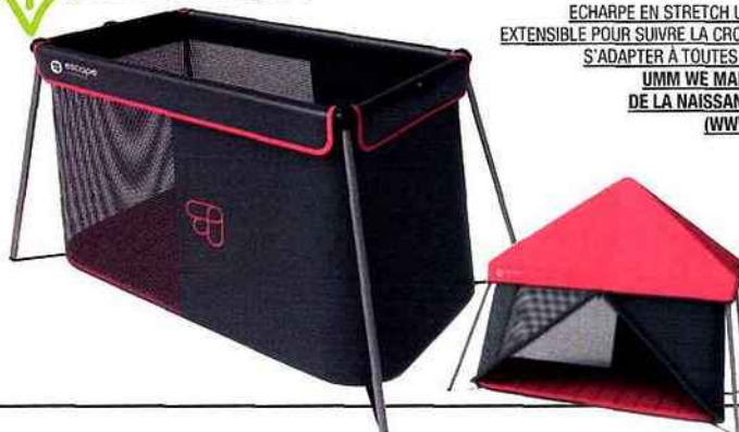
LIT DE VOYAGE AVEC MATELAS EN MOUSSE À MÉMOIRE DE FORME ET OUVERTURE SUR LE CÔTÉ. ESCAPE LIFESTYLE, NAOS, DE 0 À 4 ANS, 60 X 120 CM, 4 KG, 248 € (WWW.ESCAPE-LIFESTYLE.COM)