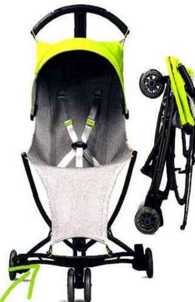
RÉSOLUTION NOMADE ET FUTURISTE. ULTRA LÉGÈRE. SON ASSISE EN TISSAGE 3D EST AUSSI CONFORTABLE QU'UN HAMAC. QUINNY, YEZZ AIR, DÈS 1 AN, 175 € (WWW.QUINNY.COM)