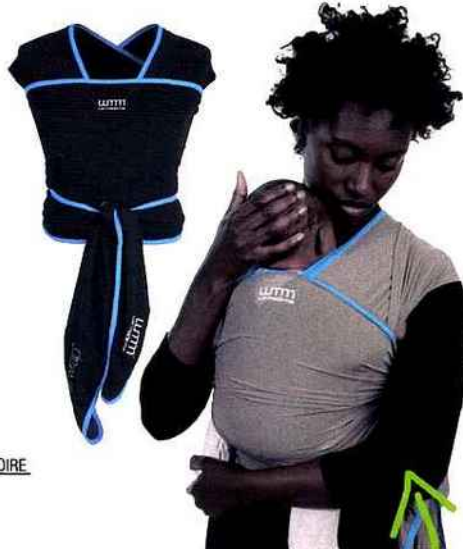
ECHARPE EN STRETCH ULTRA RESPIRABLE ET EXTENSIBLE POUR SUIVRE LA CROISSANCE DE BÉBÉ ET S'ADAPTER À TOUTES LES MORPHOLOGIES. UMM WE MADE ME, WUTTI WRAP, DE LA NAISSANCE À 15 KG, 69,90 € (WWW.WEMADEME.COM)